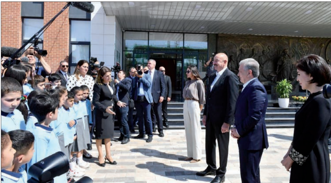
Əvvəlki sah. 1

Oktyabrın 14-də irəliləyən Azərbaycan Ordusu Füzuli rayonunun Qaradağlı, Xatnubulaq, Qarakollu və Xocavənd rayonunun Bulutan, Məlikcanlı, Qırmızıqaya, Dağdöşü, Tağaser kəndlərini işğaldan azad etdi.