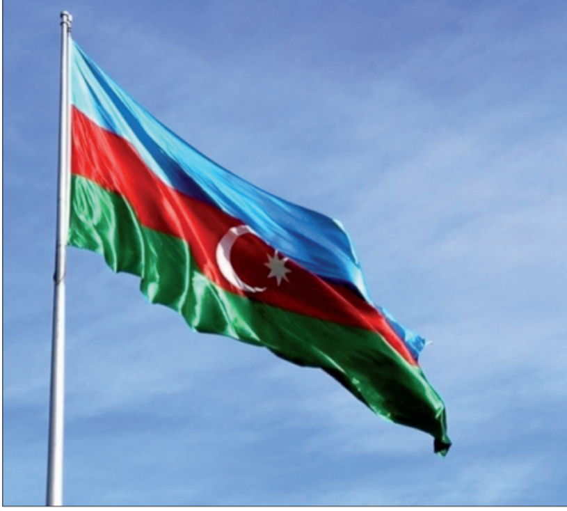
Əvvəlki sah. 1